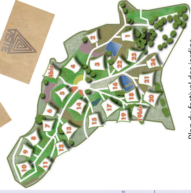
Plan du festival des jardins