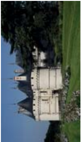
Le château de Chaumont-sur-Loire