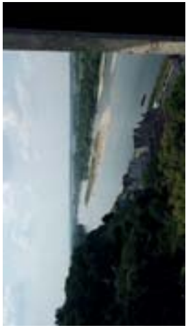
vue du château sur la Loire